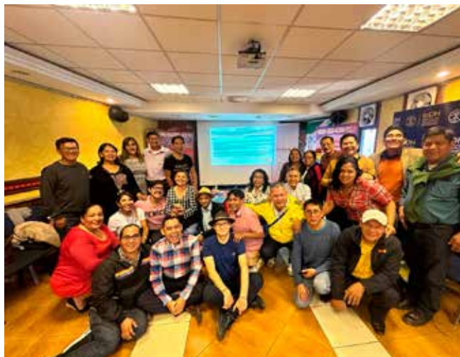
Parlons des Droits Humains avec la société civile et les Diversités sexuelles

L'IpDH met son expérience au service du processus de décentralisation, tant dans le système public que dans la sécurité sociale.