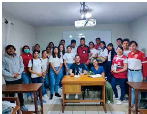
Cours avec la Croix Rouge sur les soins aux Migrants