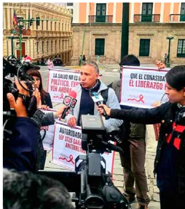
Plaidoyer à La Paz pour l'accès aux