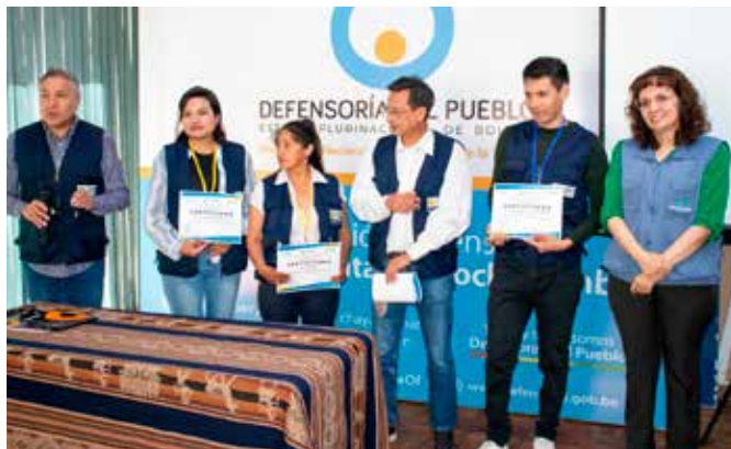
Remise des certificats aux Observateurs, avec la Défenseure du Peuple

Dans le plan d'action politique de l'IpDH, après avoir inclus la question des migrants, celle de l'hépatite et du virus du papillome humain (HPV) a été ajoutée.