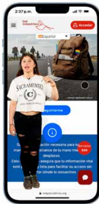
Utilisation de TikTok pour atteindre les migrants

Le travail se poursuit à petite échelle. Une valise numérique a été élaborée au niveau régional pour que la personne puisse avoir accès à ses données individuelles durant la migration. Elle est en cours de mise en œuvre. TikTok a été utilisé pour diffuser des informations.