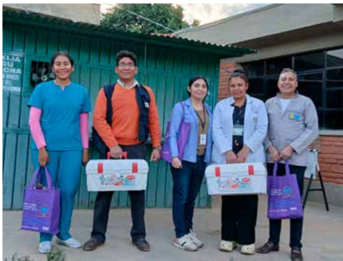
Equipe IpDH prête pour réaliser les tests rapides de VIH dans les prisons

populations vulnérables. L'évaluation a mis en évidence “la participation active des populations bénéficiaires, en tant qu'axe central du projet, à la conception, à la mise en œuvre et à l'évaluation des actions. Ce modèle de prise en charge intégrale s'est avéré plus efficace que le système public et constitue un exemple de bonnes pratiques reproductibles au niveau départemental et national” .