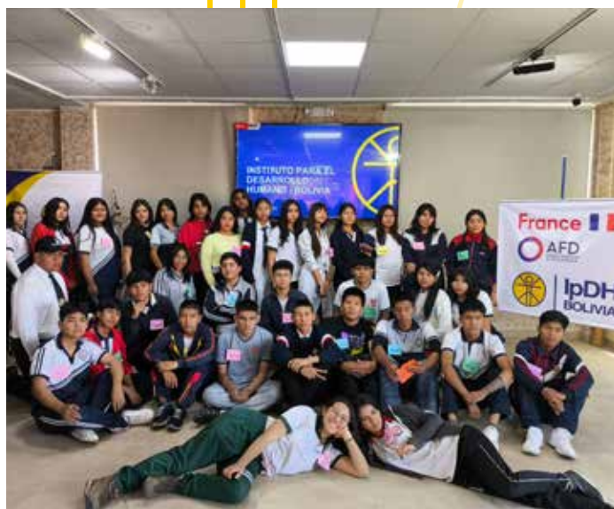
Jeunes leaders formés sur la prévention de la violence dans les relations amoureuses

Ce nouveau projet a permis de se rapprocher considérablement des adolescents et des jeunes de diverses orientations sexuelles, qui considèrent le centre de santé communautaire comme un lieu accueillant et sûr.