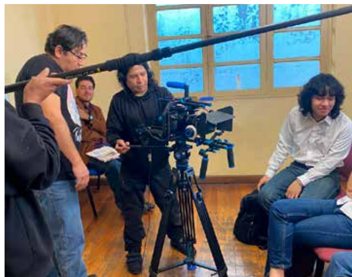
Equipe de communication lors du tournage d'un court métrage

Au cours de l'année 2025, le département de communication de l'IpDH a consolidé de manière soutenue la présence numérique institutionnelle et renforcé la visibilité des services, programmes et actions de l'Institut.