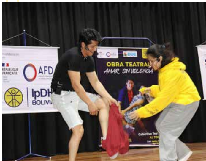
Pièce de théâtre "Amar sin violencia"

Expositions Au cours de l'année, trois expositions destinées aux jeunes et au grand public ont été organisées sur les nouvelles stratégies de prévention « VIH, la nouveauté, prévention combinée » (800 personnes), « Amour sans violence » (2 000 adolescents-es), « Sans préjugés » (312 personnes) sur le harcèlement scolaire, ont suscité une grande participation et beaucoup d'émotion chez les élèves.