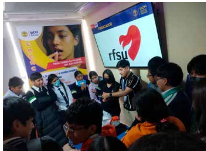
Exposition éducative sur la prévention des grossesses adolescentes

Il est important de souligner le travail conjoint que nous menons avec la Direction départementale de l'éducation de Cochabamba, les directeurs et directrices de district, les différents collèges de zones urbaines ou rurales, les enseignants et enseignantes, les parents et les élèves, sur les divers thèmes que nous abordons.