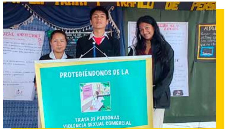
Fête de prévention de la Traite et Trafic d'adolescentes

En raison de son rôle dans la coordination du réseau départemental et du réseau national de lutte contre la traite des personnes et le trafic de migrants, l'IpdH est présent au sein du Conseil départemental, ce qui constitue un espace clé pour faire connaître le travail institutionnel.