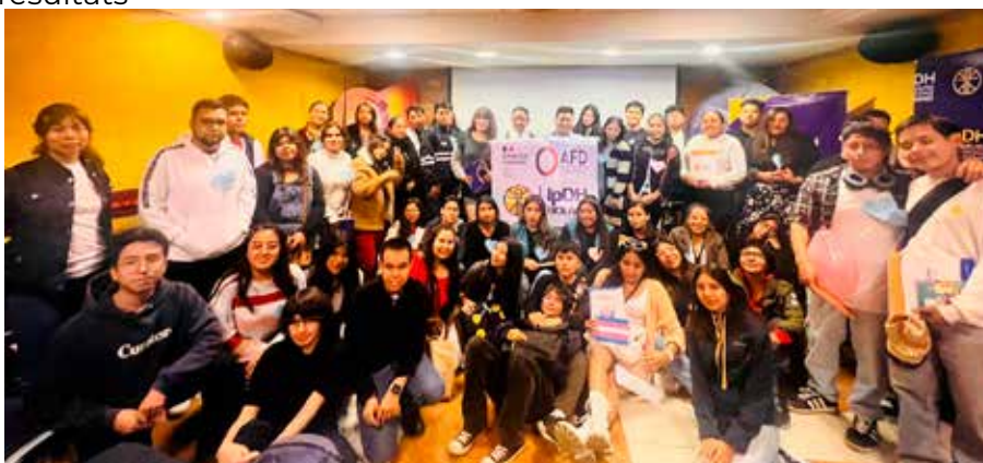
Rencontre «Parlons avec les diversités sexuelles sur l'inclusion et le respect avec les partenaires»