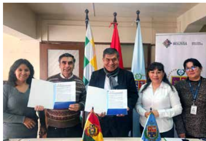
Signature de l'Accord avec la Direction Départementale d'Education pour renforcer les actions conjointes