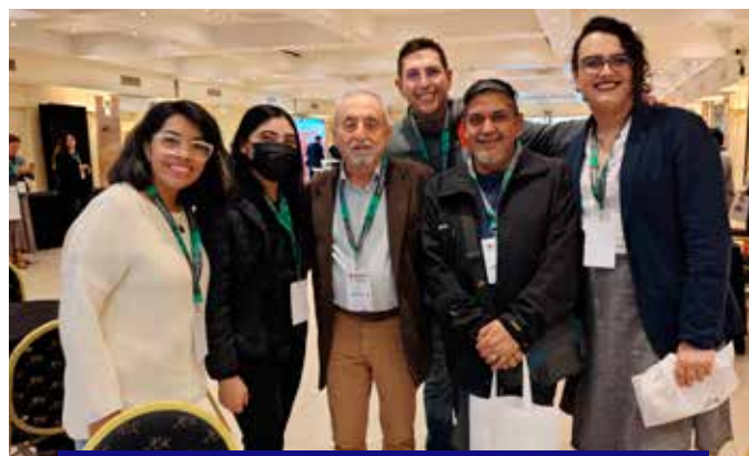
Symposium scientifique de la Fondation Huesped, Buenos Aires

Toutes ces alliances permettent à l'IpdH d'avoir un plus grand poids pour présenter ses demandes aux autorités.