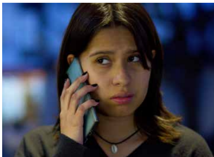
Scène du court-métrage «Love Bombing»