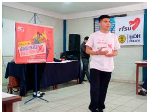
Jeune lieder partageant l'information sur la prévention des grossesses adolescentes avec ses pairs

L'impact du projet va au-delà des indicateurs quantitatifs, il génère des changements qualitatifs qui ouvrent la voie à une prévention plus efficace, plus inclusive et plus durable dans le temps, notamment avec la réflexion sur le consentement et les projets de vie.