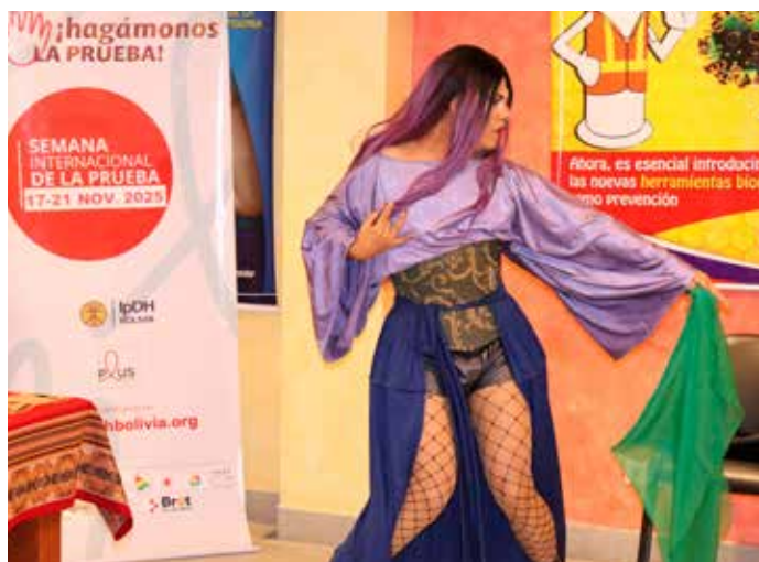
Drag Queen lors de l'inauguration de la SIP 2025