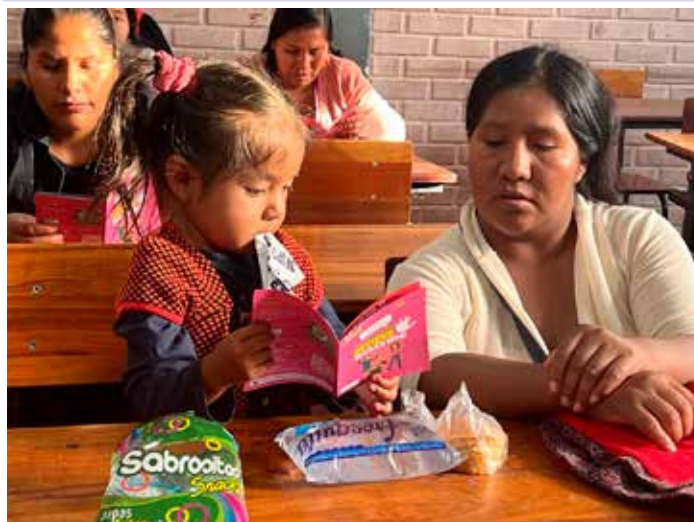
Atelier des parents d'élèves sur le respect et la convivialité à l'école