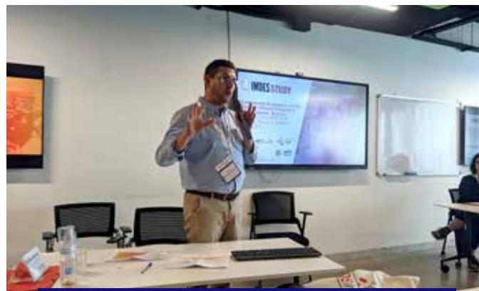
Présentation des résultats de l'Etude IMDES à AIDS Impact 2025, Maroc

Les résultats d'enquêtes servent à justifier les actions de plaidoyer auprès des autorités.