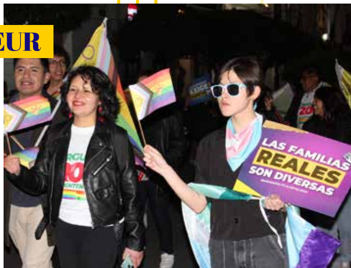
Participation à la Marche des Fiertés à Cochabamba

La 6e Semaine Internationale de Dépistage , avec le soutien de la Coalition PLUS, a réuni 53 organisations de 43 pays et Frontline AIDS dans 100 pays. A Cochabamba la campagne a atteint 2.167 personnes , dont 926 détenus de la prison pour hommes de Cochabamba «San Sebastián». La SIP s'est imposée comme un événement majeur du dépistage gratuit du VIH et d'autres IST à Cochabamba, et a impliqué la participation de toute l'équipe de l'IpDH.