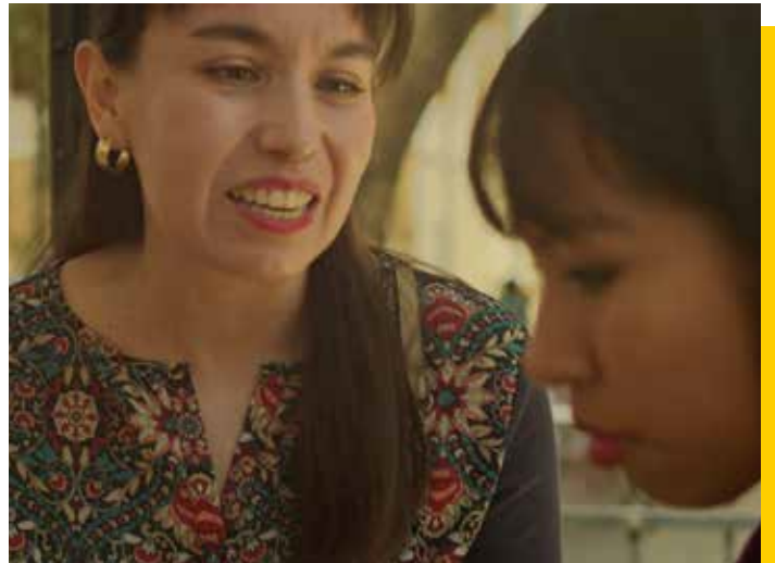
Scène du court métrage "Fausses promesses"