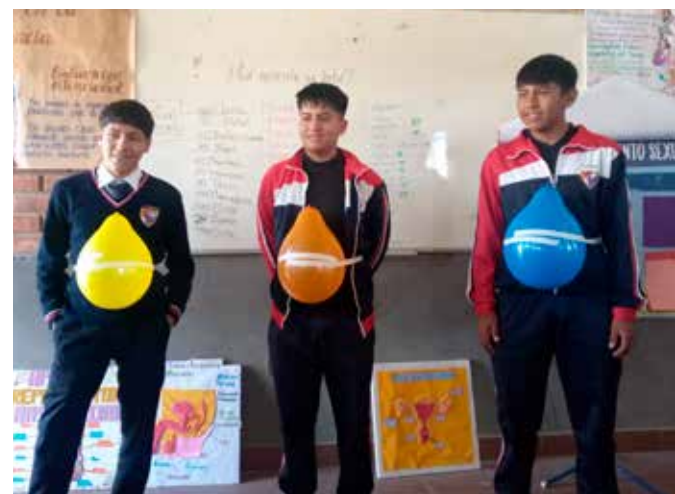
Dynamiques interactives lors du cours sur la prévention des grossesses adolescentes